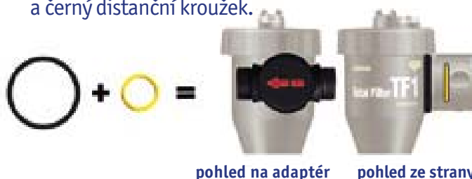
pohled na adaptér pohled ze strany

Pro montáž do vodorovného potrubí se směrem proudění zleva doprava přidejte žlutý O-kroužek a černý distanční kroužek.