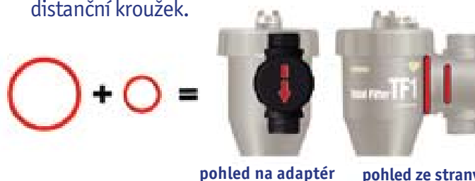
pohled na adaptér pohled ze strany

Pro montáž do svislého potrubí se směrem proudění shora dolů přidejte červený O-kroužek a červený distanční kroužek.