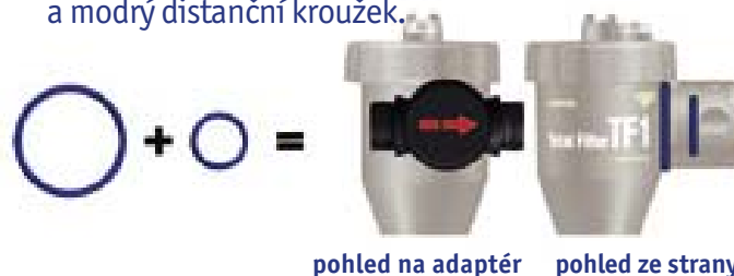
pohled na adaptér pohled ze strany

Pro montáž do vodorovného potrubí se směrem proudění zprava doleva přidejte modrý O-kroužek a modrý distanční kroužek.